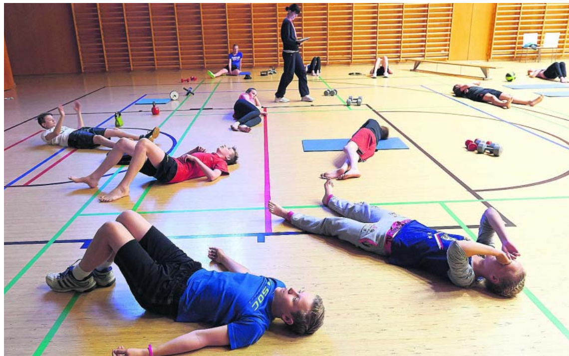
Espoolaisen Juvanpuiston koulun oppilaat vetivät henkeä liikuntatunnilla toukokuussa 2014.