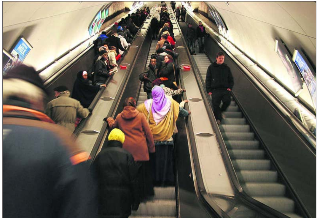
Kampin metroaseman liukuportaat ovat Suomen pisimmät. Niillä on korkeutta melkein 30 metriä.