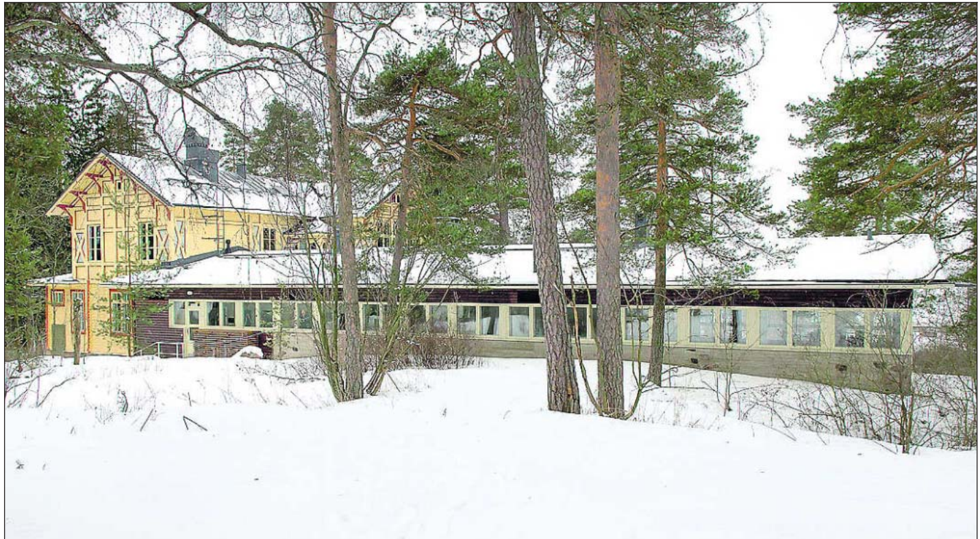
Seurasaaren ravintola on vasta kuoriutunut peruskorjauksen alta. Kahvila on auki viikonloppuisin maaliskuun puolen välin jälkeen.