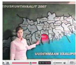
Sauli Niinistön vaalikierrosta seurataan kartalla.

uutisia", eli viikoittainen viihteellinen uutiskatsaus Niinistön tekemisiin. Kestot 3–4 minuuttia. Poliitiikka: Poliittista kantaa ei esitetty selkeästi. Toteutus: Voisi olla ulkopuolinen vitisi. Erioinen, jännä idea. Viesti: Sauli-ilmiö. Sauli jäi etäiseksi. Järki vs. tunne: Ei järkeen vetoava. Kohderyhmä: Saulin fanit. Erikoista: Superman Sauli -logo. Kouluarvosana: 7